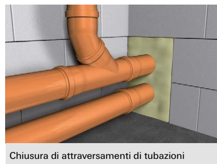
Chiusura di attraversamenti di tubazioni