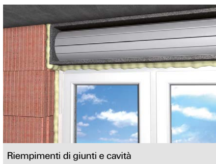
Riempimenti di giunti e cavità